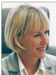
Margot Wallström Commissaire à l'environnement, Commission Européenne

«Des administrations publiques qui à tous les niveaux contribuent à la réalisation d'une Europe durable – j'applaudis ce mouvement.»